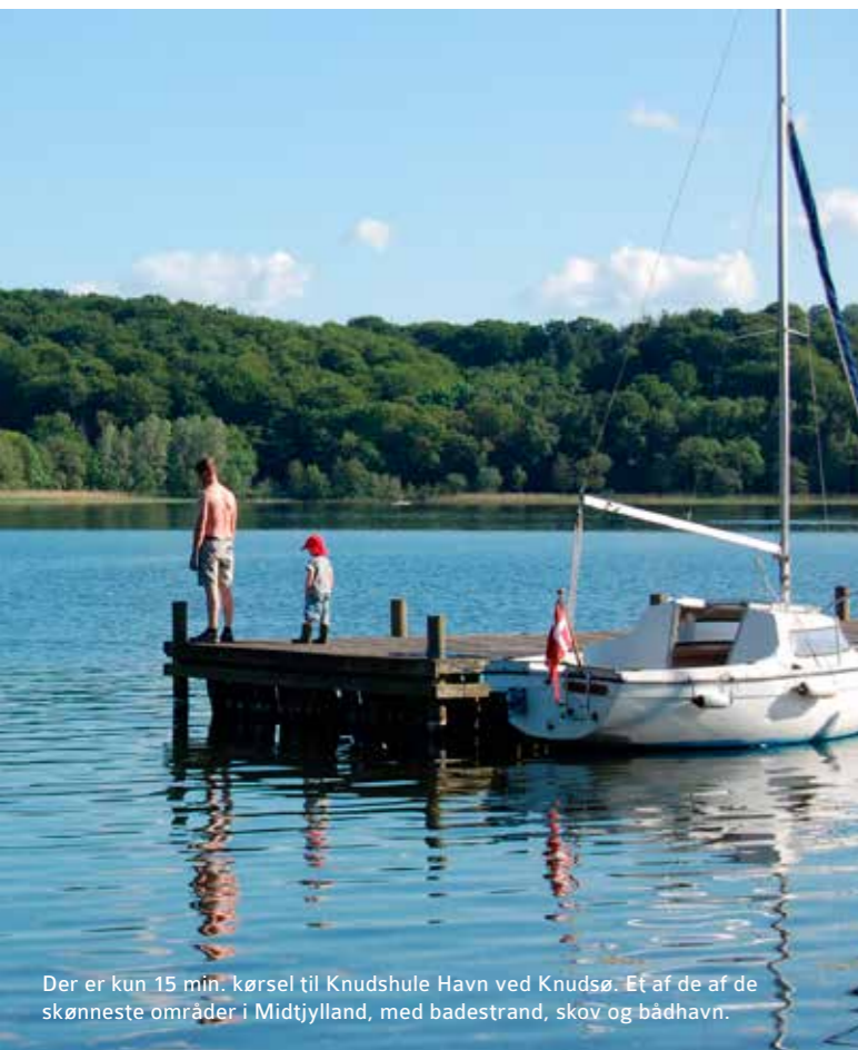
Der er kun 15 min. kørsel til Knudshule Havn ved Knudsø. Et af de af de skønneste områder i Midtjylland, med badestrand, skov og bådhavn.